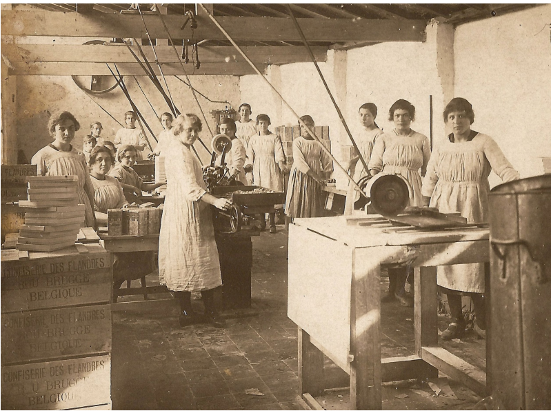
Het atelier van Confiserie Dehaeck in Roesbrugge.