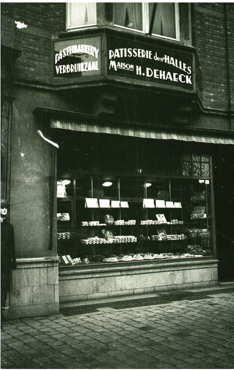
Bakkerij Pâtisserie des Halles in de Rijselstraat.