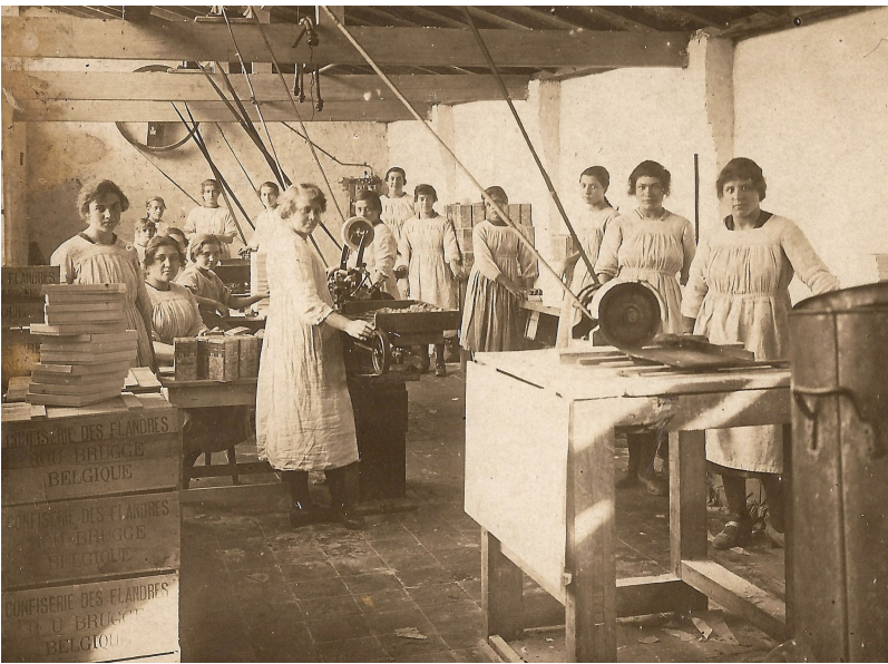
Het atelier van Confiserie Dehaeck in Roesbrugge.