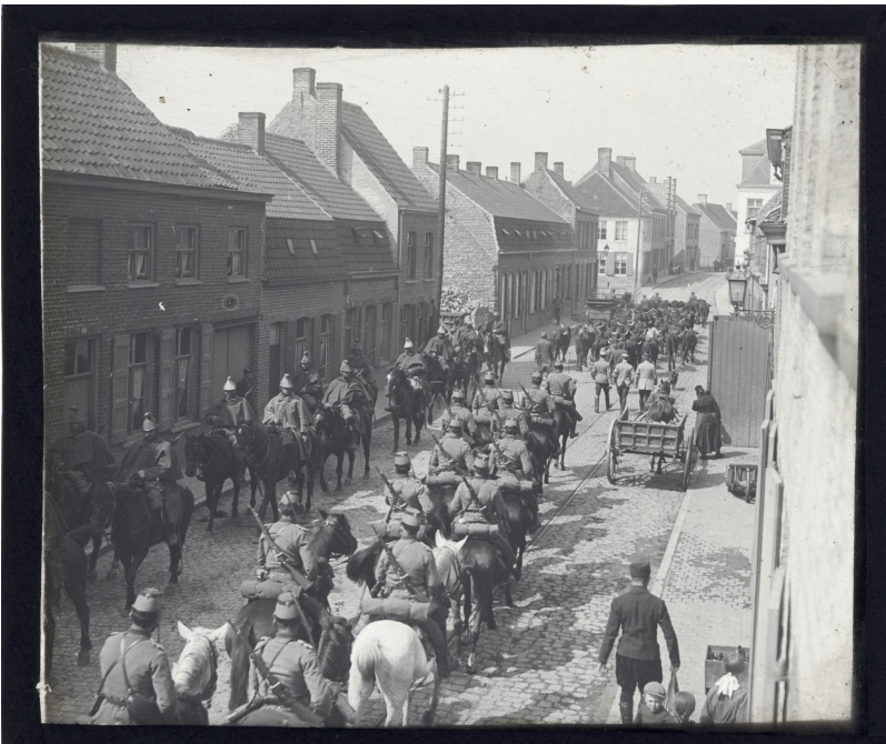
Op deze glasplaat van Hector Dehaeck is te zien hoe een legerenheid tijdens de Eerste Wereldoorlog marcheert langs de Bergenstraat in Roesbrugge.

Naast zijn werk in de zoetwaren had Hector een grote passie voor fotografie. Vanuit zijn slaapkamerraam en tijdens fietstochten door de Westhoek legde hij oorlogstaferelen vast. Zo maakte hij samen met het Franse bedrijf Léon & Lévy honderden postkaarten tijdens de oorlog.